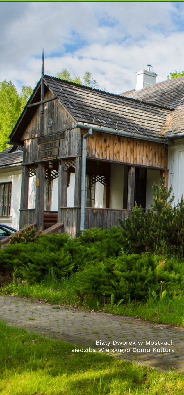
Biały Dworek w Mostkach siedziba Wiejskiego Domu Kultury

Mostki pochodzą z około 1550 roku. Istniała tu już wówczas “kuźnica” funkcjonująca prawdopodobnie nieprzerwanie aż do roku 1748 kiedy to rozpoczęto budowę wielkiego pieca w Mostkach, nad rzeką Kaczką, z inicjatywy biskupa krakowskiego. Wielki piec w Mostkach jak większość zakładów wielkopiecowych nad Kamienną pracował do roku 1903 osiągając maksymalną produkcję w roku 1893 - 2.900 ton surówki. Tu w czasach obu powstań (listopadowego i styczniowego) wyrabiano broń, odlewano działa, kule, kuto kosy, szable.